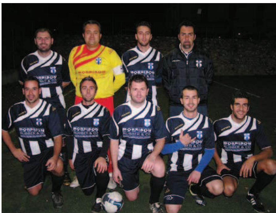
Categoria Open a sette giocatori - Centro Giovanile Rogno