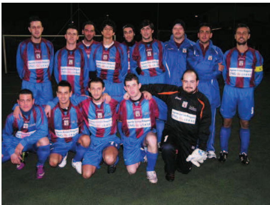
Categoria Open a sette giocatori - Civate Iunaited